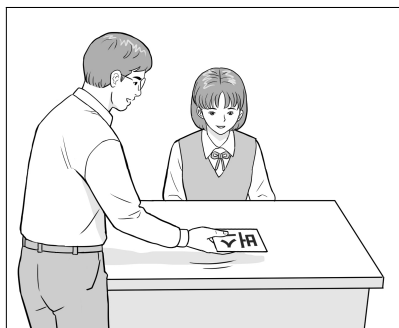
<움직이는 단어 카드 읽기>